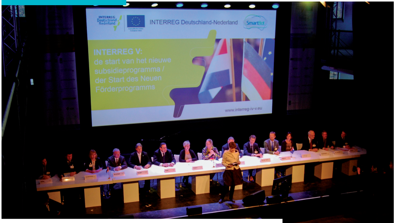
Ondertekening van de nieuwe INTERREG-overeenkomst op 19 november 2014 in Hengelo