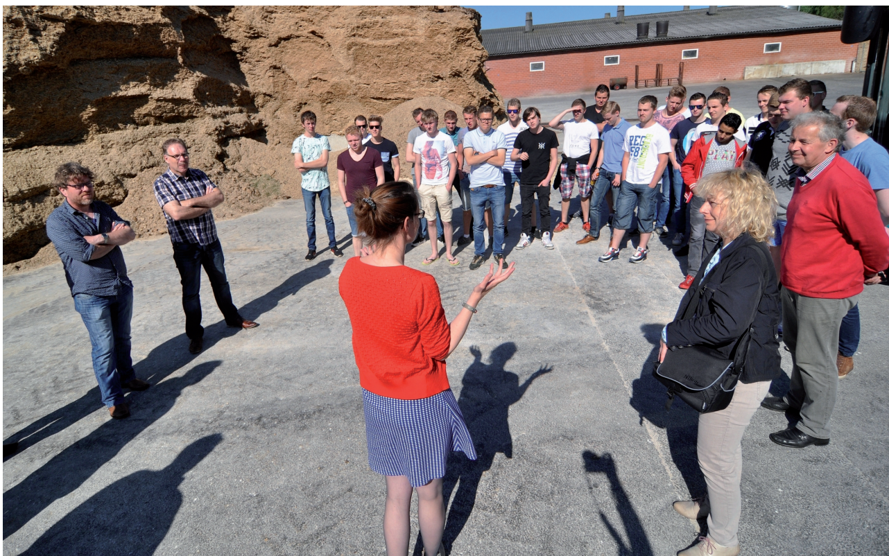
De scholieren hadden veel plezier bij hun rondleiding door het Klimacenter in Werlte

De derde prioriteit van het INTERREG V A programma Deutschland-Nederland is de Technische bijstand. Zo wordt het beheer en de technisch-administratieve uitvoering van het programma genoemd. Dit gebeurt door middel van verschillende programma-instanties. Voor alle middelen die de verschillende programma-instanties voor hun bijdrage aan de programma-uitvoering ontvangen vindt de administratie plaats onder deze prioriteit. Aan deze prioriteit mag maximaal 6% van de programma-middelen worden toebedeeld.