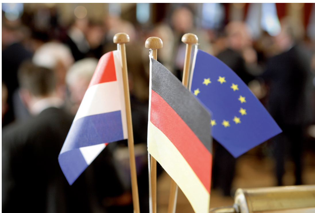
INTERREG V A Deutschland - Nederland