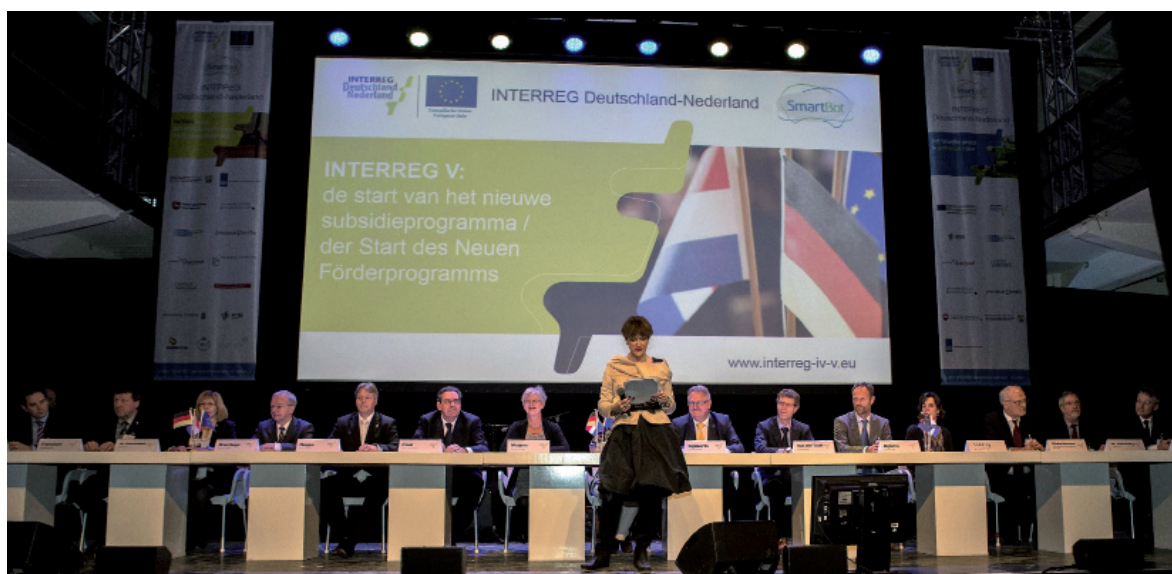
De start van het nieuwe programma INTERREG V A Deutschland - Nederland

In deze brochure worden de uitvoering van het programma en de activiteiten van het INTERREG V A-programma Deutschland-Nederland in het jaar 2015 beschreven. Het begint met een overzicht van enkele kernaspecten van het programma en daarna wordt op de ontwikkelingen in 2015 ingegaan. Er is in dit jaarverslag ook weer plaats gecreëerd voor projectvoorbeelden. Zo krijgt u een idee van de veelzijdigheid van INTERREG.