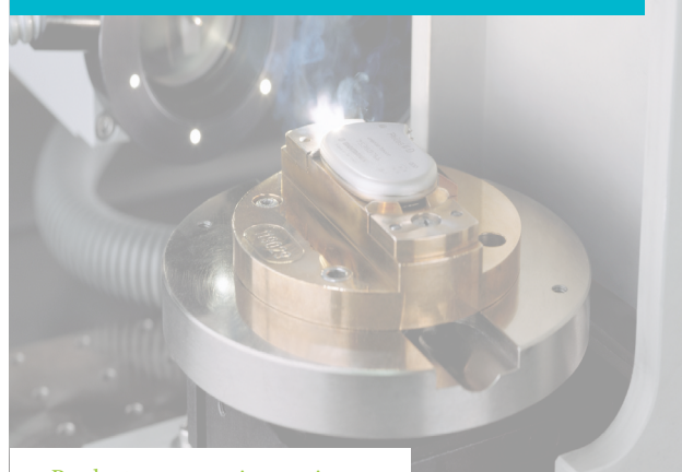
Product- en procesinnovaties